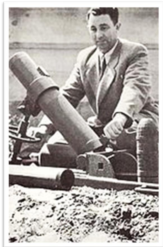
בתמונה: דוד לייבוביץ, ויקיפדיה

הדוידקה היא מרגמה בקוטר 3 אינטש. מרגמת הדוידקה פותחה בראשית מלחמת העצמאות על ידי דוד לייבוביץ , שהיה הנשק של ה"הגנה" בחזית הדרום, ונקראת על שמו. היא פותחה בשני דגמים: הקל, עם פגז במשקל 12 ק"ג וטווח 750 מטר, והכבד, עם פגז במשקל 37 ק"ג וטווח של 350 מטר (וכעבור זמן מה, אחרי שיפור, ניתן היה להגיע לטווח של כ-900 מטר).